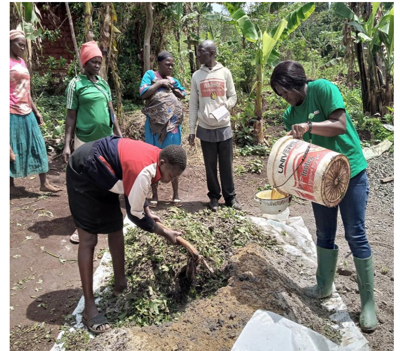
Formation des membres du local local de Balessing en fabrication et utilisation du compost de 21 jours