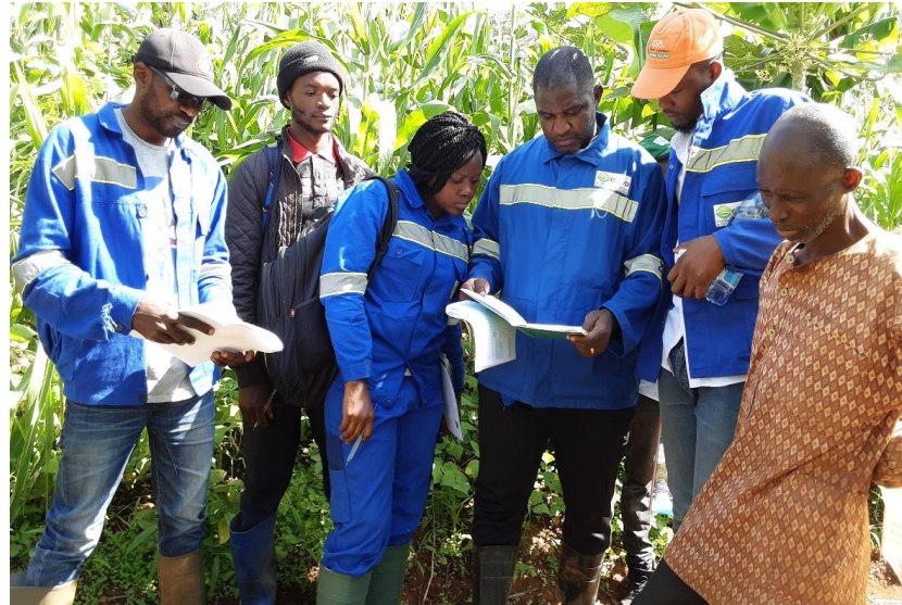
Visite de certification chez un producteur bio du SPG Etso Mbong