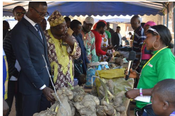
Visite des autorités administrative à la foire des semences ancestrales