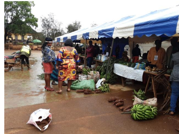
Marché périodique de vente des produits biologiques