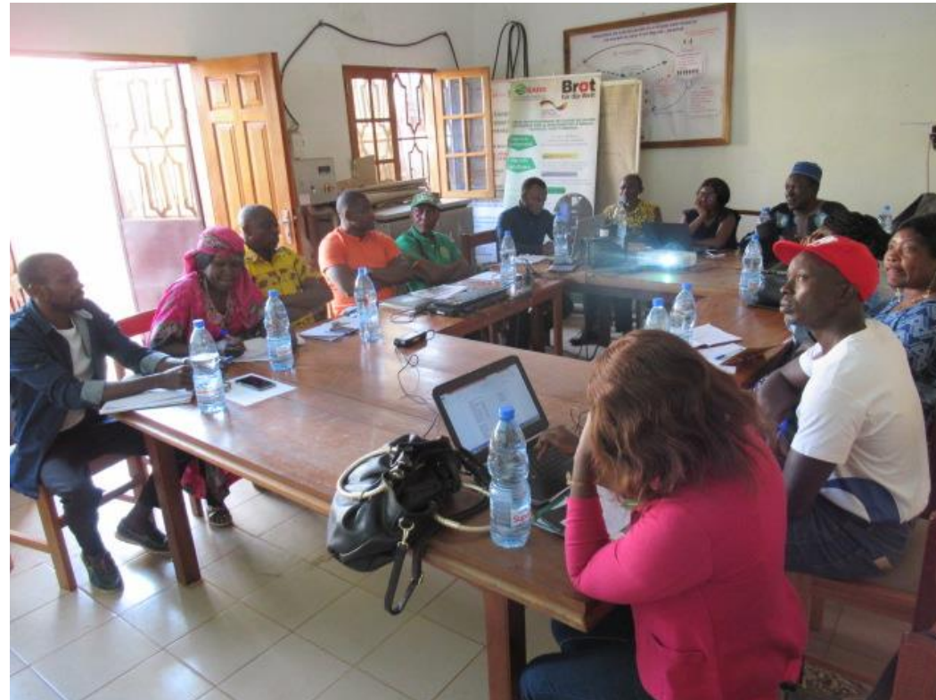
Réunion du conseil départemental du SPG Etso Mbong pour la révision des ses outils

Le conseil départemental est l'instance de recours en cas de litige et peut pour cela être saisie par tout opérateur-ice